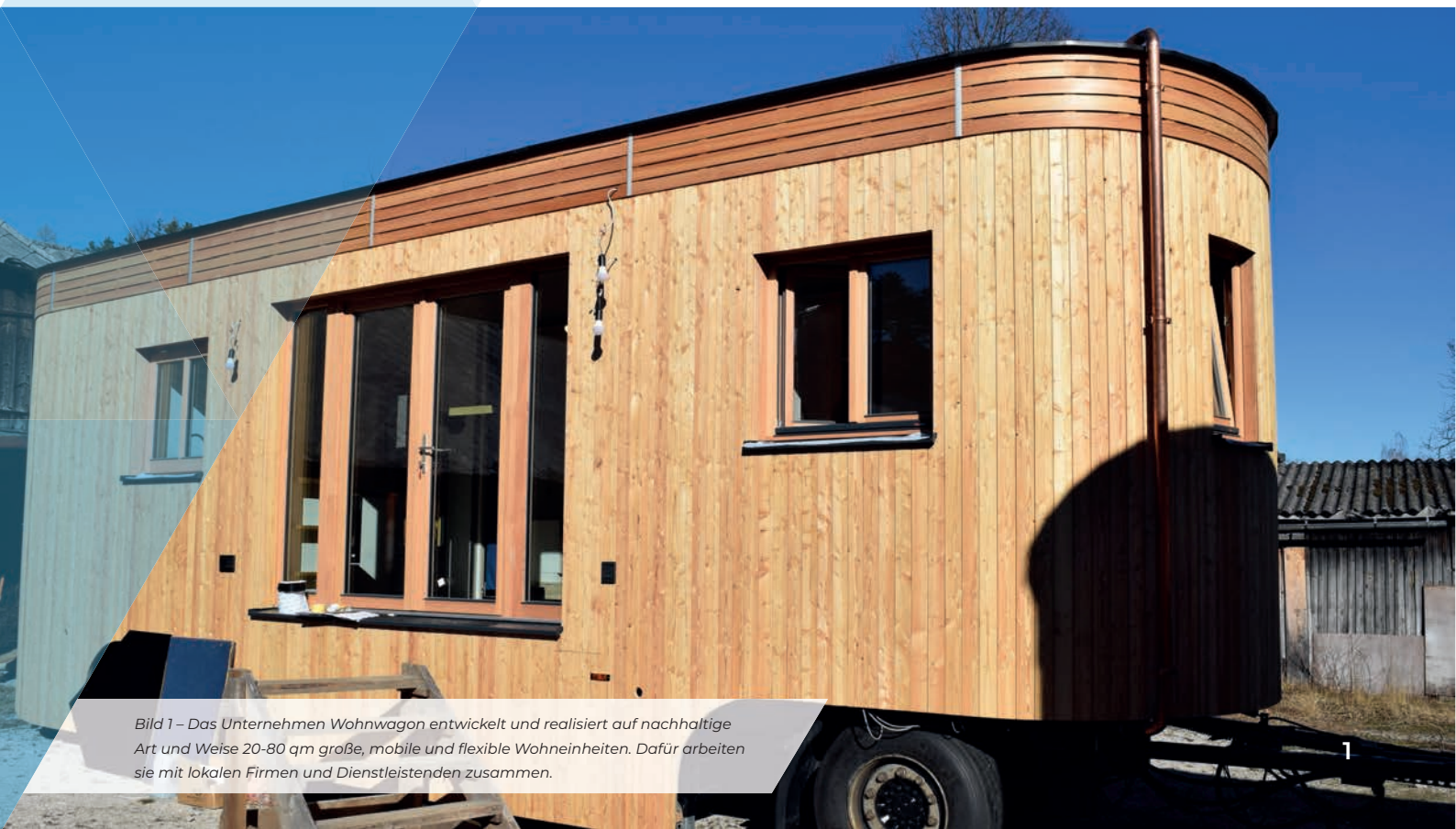
Bild 1 – Das Unternehmen Wohnwagen entwickelt und realisiert auf nachhaltige Art und Weise 20-80 qm große, mobile und flexible Wohneinheiten. Dafür arbeiten sie mit lokalen Firmen und Dienstleistenden zusammen.

Ebenso besonders ist auch der Workflow bei Wohnwagen. Da mit vier verschiedenen großen Basismodulen gearbeitet wird, die je nach Anforderung nur ergänzt werden müssen, entfällt die Ausführungsplanung sowie Zwischenhändler und es kann direkt von der Planung in die Ausführung gestartet werden. Das ermöglicht es dem Team, ein persönliches Verhältnis zu den Kundinnen und Kunden aufzubauen und die komplette Nachbetreuung der Bauten selbst zu übernehmen.