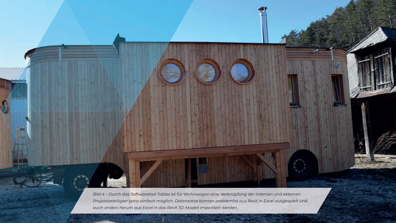
Bild 4 – Durch das Softwaretool Tables ist für Wohnwagen eine Verknüpfung der internen und externen Projektbeteiligter ganz einfach möglich. Datensätze können problemlos aus Revit in Excel ausgespielt und auch anders herum aus Excel in das Revit 3D-Modell importiert werden.